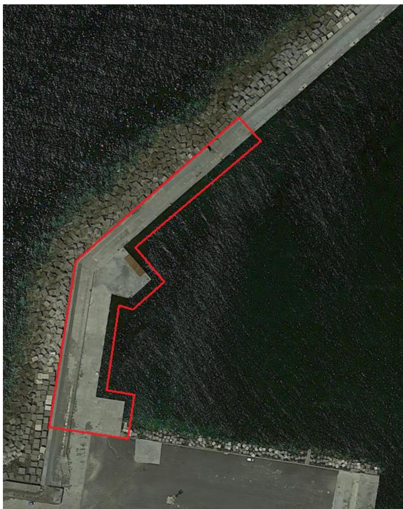
Particolare dell'area di cantiere